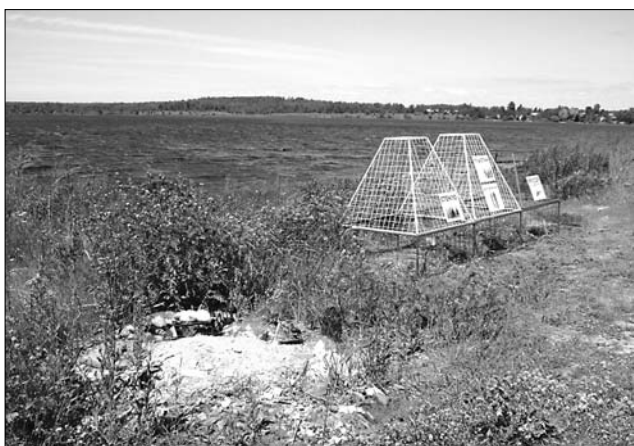
В поселке Свингино сделан шаг от мусорных куч – к контейнерам для раздельного сбора мусора

Чтобы народ не сомневался в их предназначении, на желто-зеленых пирамидках имеются пояснительные таблички «Стекло», «Пластик–Алюминий», на приземистой красно-зеленой пирамидке с усеченным верхом табличка гласит «Мусор в пакетах».